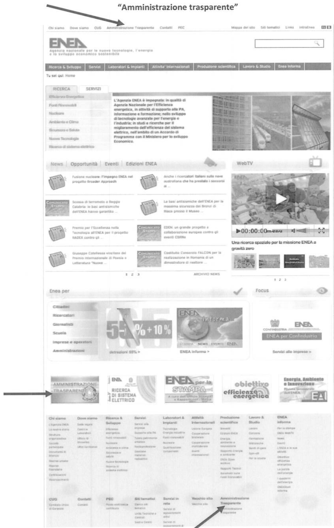
Fig. 1 - Home page ENEA con l'indicazione delle tre modalità per accedere alla sezione "Amministrazione trasparente"

Programma triennale per la trasparenza e l'integrità 2014-2016