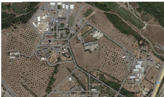
Figura 3 – Centro di Ricerca ENEA Trisaia

AGENZIA NAZIONALE PER LE NUOVE TECNOLOGIE, L'ENERGIA E LO SVILUPPO ECONOMICO SOSTENIBILE